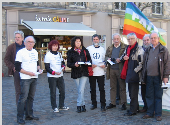
27 mars, distribution de tracts à Quimper

ARAC – AFPS Cornouaille- Mouvement de la Paix – 4ACG - Université Européenne de la Paix