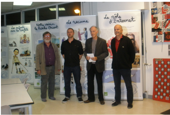
Lors du vernissage de l'expo.

Selon une information de Mediapart « Un cahier d'enseignement moral et civique » destiné aux classes de 3ème explique aux élèves comment « l'arme nucléaire française permet de soutenir la liberté et la démocratie ». Qu'en est-il de la pédagogie du désarmement nucléaire ? Est-il nécessaire d'entretenir chez nos jeunes un esprit d'agressivité ?