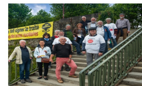
La banderole est installée...et elle se voit de loin