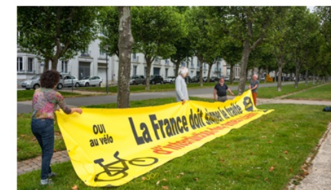
10 mètres sur 1,70 : une sacrée banderole !

Aussi, en dépit des contraintes sanitaires qui en rendaient difficile l'accès, le CIAN29 était présent le 24 juin sur le cours Dajot, surplombant le village du tour. Il y a déployé plusieurs heures durant une banderole pour rappeler que la France se doit de signer le Traité d'Interdiction des Armes Nucléaires (TIAN) voté par les deux tiers des pays de l'ONU le 7 juillet 2017.